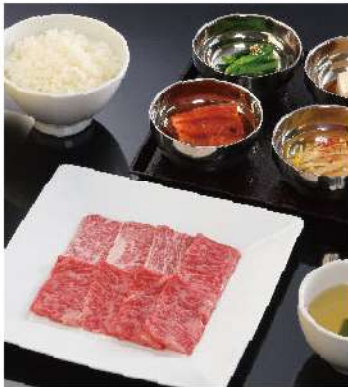
和牛不揃い カルビ焼ランチ