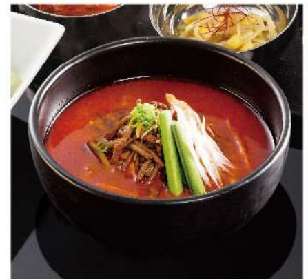
ユッケジャンスープランチ