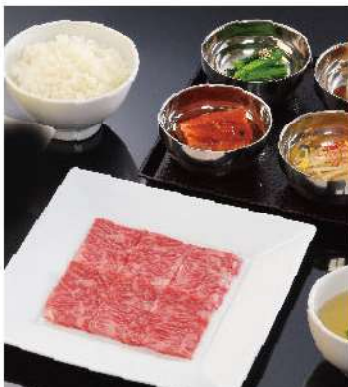
和牛 カルビ焼ランチ