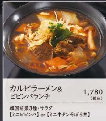
カルビラーメン& ビビンバランチ 1,780 (税込)