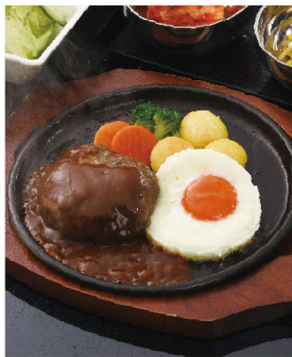
鉄板ビーフハンバーグランチ