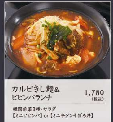
カルビしし麺& ビビンバランチ 1,780 (税込)