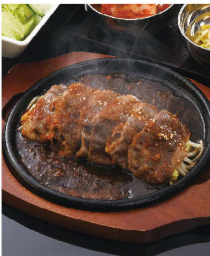
鉄板 和牛カルビ焼ランチ