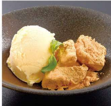
黒糖わらび餅アイス添え