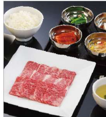
特盛 和牛不揃い カルビ焼ランチ