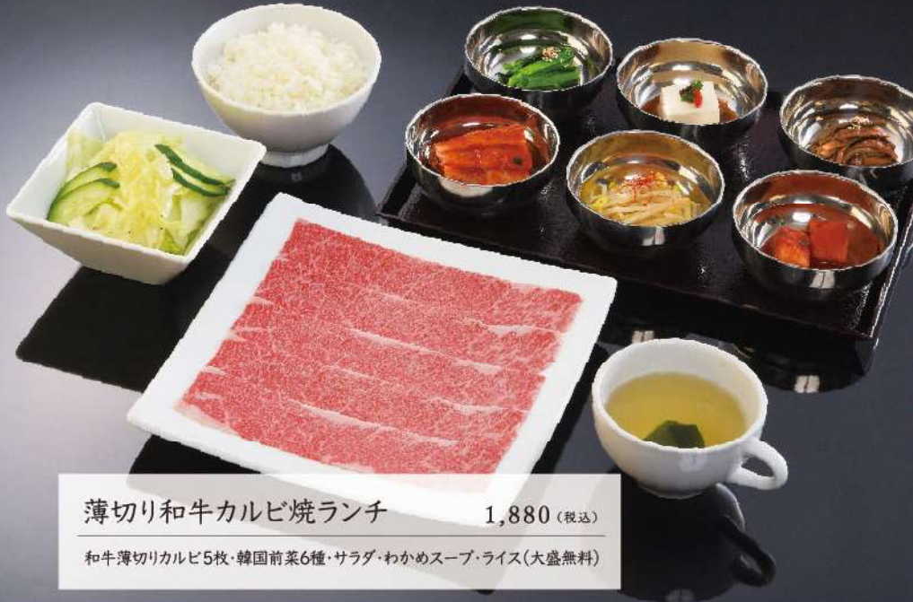
薄切り和牛カルビ焼ランチ 1,880 (税込)