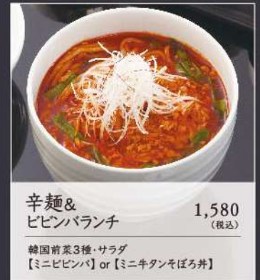
辛麺& ビビンバランチ 1,580 (税込)