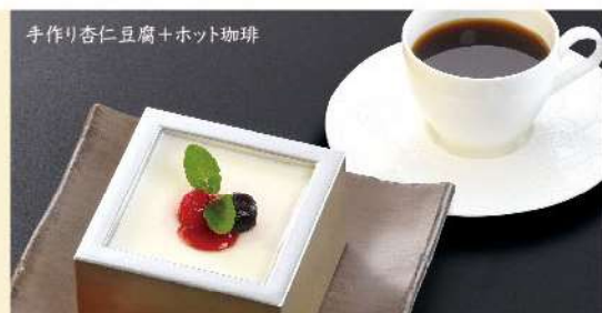
手作り杏仁豆腐+ホット珈琲