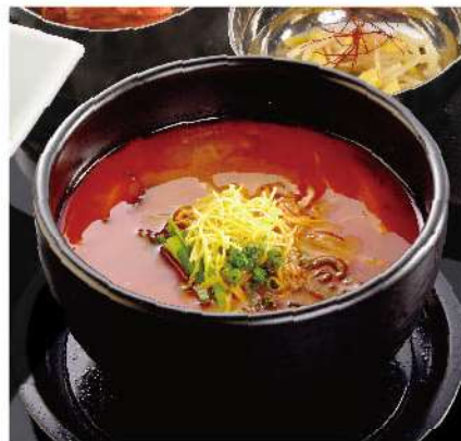
テグダンスープランチ