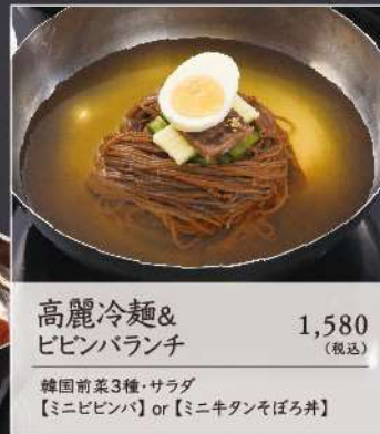
高麗冷麺& ビビンバランチ 1,580 (税込)