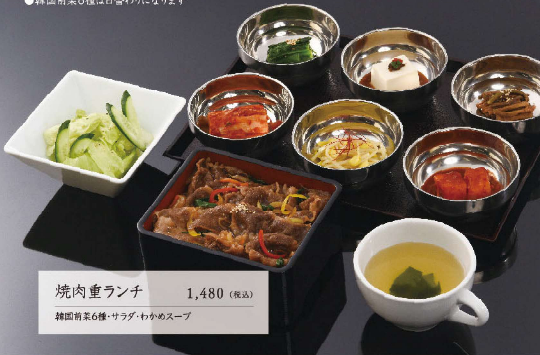
焼肉重ランチ 1,480 (税込)