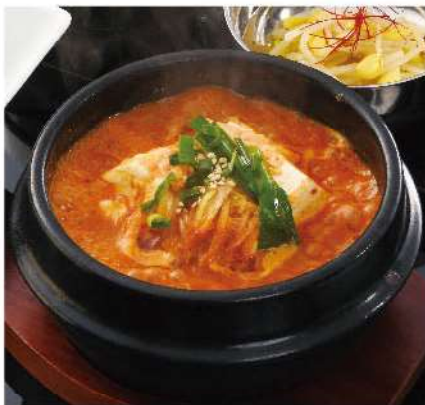
ストゥブチゲランチ