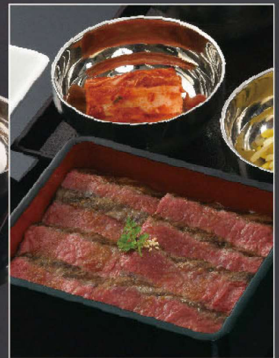
プレミアムステーキ重ランチ