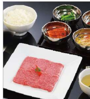
和牛 上焼肉ランチ