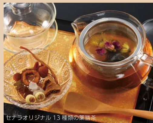
セナラオリジナル 13 種類の薬膳茶