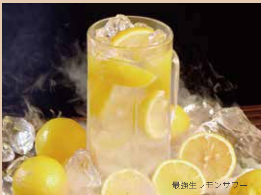
最強生レモンサワー