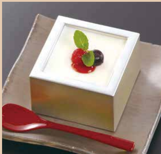
手作り杏仁豆腐 480(税込528)