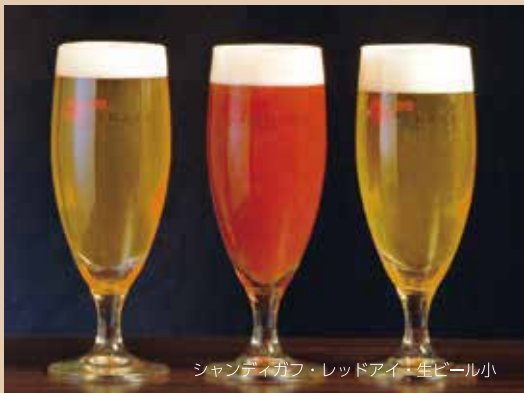
シャンディガフ・レッドアイ・生ビール小