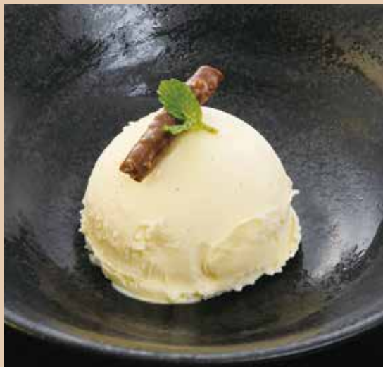
アイスクリーム ALL 380(税込418) バニラ / 抹茶 / チョコレート